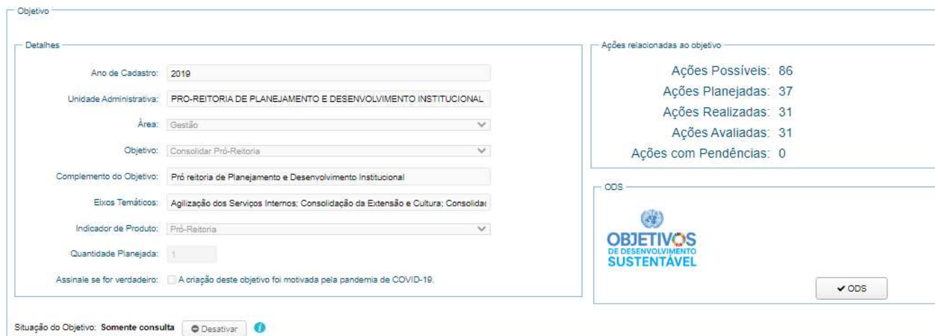
Figura 1- Quadro de visualização da Classificação ODS para o Objetivo.

Na Figura 1 o ícone que aparece (criado pela ONU) indica que não há nenhuma seleção para este objetivo.